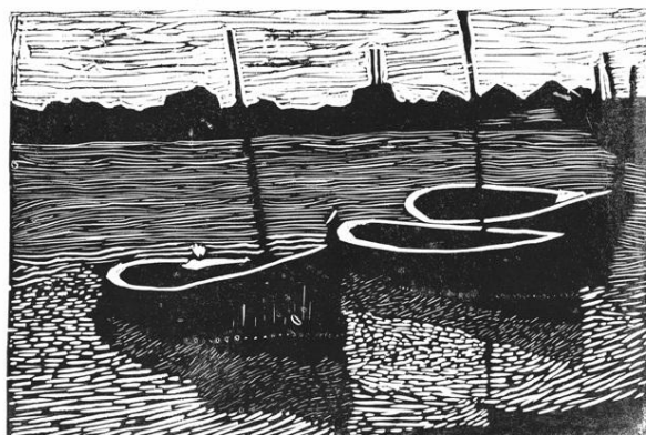
Bartłomiej Harnasz, 14 let, MDK pracownia plastyczna „Creatio”, Rybnik, Polsko