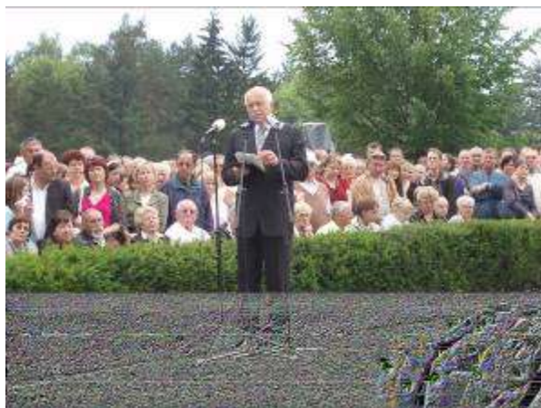
Prezident České republiky Václav Klaus

⊕ Následně po oficiální pietní vzpomínce následoval pietní akt KSČM, jehož účastníci se také sešli v hledišti přehlídky dětských sborů. Podle odhadu prošlo v tento den Památníkem Lidice zhruba 8 tis. spokojených návštěvníků.