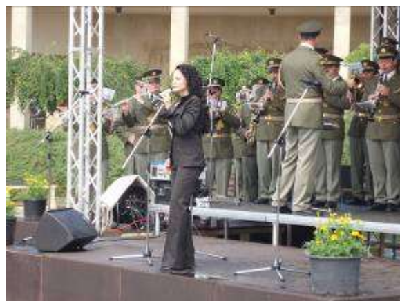
Lucie Bílá v doprovodu Pražské posádkové hudby