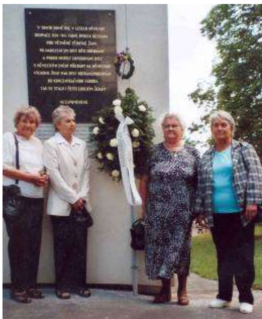
Fotografie žen z Lidic - „lidických dětí“ u pamětní desky na domě v Praze 10, v Dykové ulici

Třetím místem uctění památky a položením věnce a kytice bylo na místě zastřelených 26 lidických občanů v Praze-Kobylisích.