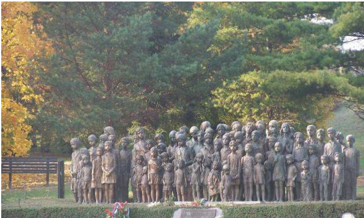
Pomník dětských obětí války