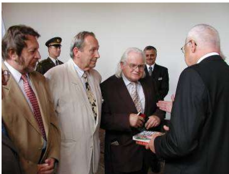
Setkání představitelů KALF a města Letohrad s prezidentem republiky Václavem Klausem.