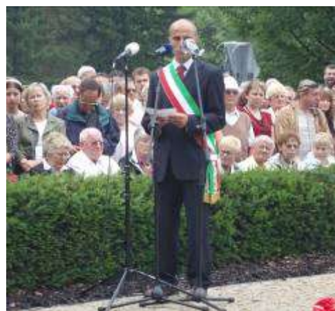
Starosta města Bucine (Itálie)

⊕ Nejvýznamnějším počinem byla celostátní přehlídka dětských pěveckých sborů „Světlo za Lidice“, která se uskutečnila bezprostředně po pietní vzpomínce v prostoru u gloriety před muzeem. Přehlídka se zúčastnilo 14 sborů z jednotlivých krajů a vystoupilo zde téměř 600 účinkujících. Slavnostní zahájení provedl předseda Senátu Přemysl Sobotka a úvodní písně zazněly v podání Lucie Bílé, která převzala uměleckou záštitu. Zahájení přehlídky byl osobně přítomen i prezident republiky a celá řada vzácných hostů z veřejného a politického života.