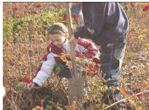
Děti z 5. ZŠ Kladno při sázení růží

⊕ V první polovině roku probíhala nová mezinárodní internetová vědomostní soutěž pro mládež ve věku od 11 do 18 let pod názvem „Lidice pro 21. století“, již se v druhém ročníku zúčastnilo přesně 1000 dětí. Obsahem soutěže jsou vědomostní testy zpracované historikem PhDr. E. Stehlíkem a literární práce na předem dané téma. Tato soutěž se týká zejména lidické tragédie, událostí druhé světové války a zahraničního odboje. Slavnostní vyhlášení výsledků s předáním cen vítězům a zvláštních ocenění poroty v jednotlivých kategoriích se uskutečnilo 21. června v Lidické galerii. Na vítěze čekal mimo jiné vyhlídkový let nad středočeským regionem a týdenní pobyt v italském městě Bucine.