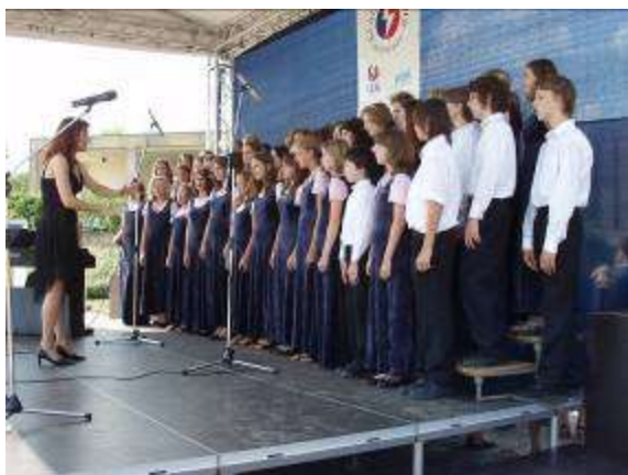
Dětský pěvecký sbor

⊕ Nejvýznamnějším počinem byla celostátní přehlídka dětských pěveckých sborů „Světlo za Lidice“, která se uskutečnila bezprostředně po pietní vzpomínce v prostoru u gloriety před muzeem. Přehlídka se zúčastnilo 14 sborů z jednotlivých krajů a vystoupilo zde téměř 600 účinkujících. Slavnostní zahájení provedl předseda Senátu Přemysl Sobotka a úvodní písně zazněly v podání Lucie Bílé, která převzala uměleckou záštitu. Zahájení přehlídky byl osobně přítomen i prezident republiky a celá řada vzácných hostů z veřejného a politického života.