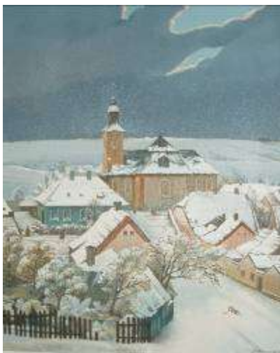
J.Bohdanecký, Lidický kostel

Pracovníci Památníku poskytují informace a odborné konzultace studentům, badatelům, pracovníkům masmédií, ale i řadovým občanům z celého světa. Památník Lidice spolupracuje při poskytování služeb s řadou institucí a organizací z domova i ze zahraničí.