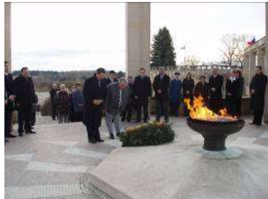
Pokládání věnců u věčného ohně

⊕ Od 8.června do 10. června 2007 proběhla ve výstavní síni Pod Tribunou výstava Irisů – „Přehlídka nejnovějších odrůd kosatců“ Českého svazu zahrádkářů a Botanického výzkumného ústavu Průhonice. Tato výstava byla doprovodnou akcí k 65. výročí lidické tragédie.