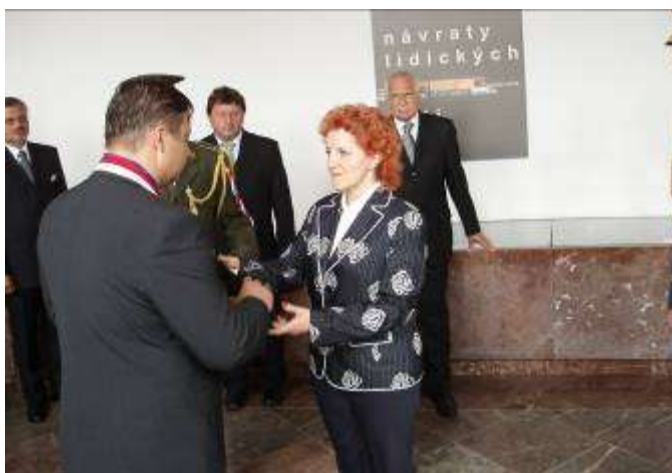
Ministryně obrany Vlasta Parkanová předává kříž starostovi obce Lidice

⊕ Ministryně obrany Vlasta Parkanová předala bezprostředně po pietní vzpomínce v prostoru IN MEMORIAM Záslužné kříže obcím Lidice a Ležáky. Ocenění převzali z jejich rukou starostové obou obcí za přítomnosti prezidenta republiky Václava Klause.