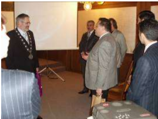
Přijetí ázerbájdžánské delegace primátorem města Kladna